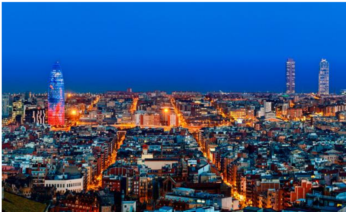
Barcelona by night

Vi välkomnar alla på vår 8-dagars flygresa till Barcelona, Kataloniens huvudstad och Spaniens näst största stad! Boendet är i Malgrat de Mar på den vackra Costa Brava-kusten norr om staden. Barcelona är en världsmetropol som erbjuder det mesta – enastående kultur, otrolig arkitektur, sol, bad, fantastisk gastronomi och självklart fotboll i världsklass. På dagarna strosar man gärna längs stadens mest kända gata La Rambla där det finns både uteserveringar och köpcentrum. Under resans gång får vi även lära känna Barcelonas omgivningar och den vackra kusten norr om staden. Vi bor i Malgrat de Mar som är en av Costa Bravas många trevliga badorter. Hjärtligt välkomna till en härlig sensommarresa!