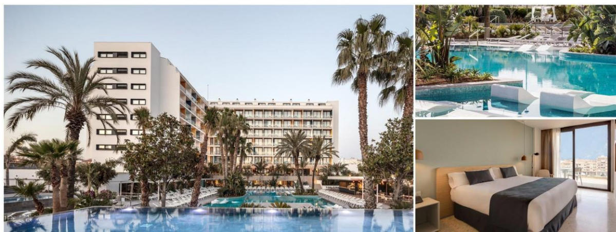
Vårt hotell i Malgrat de Mar