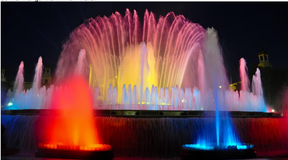
La Font Mágica – vattenspelet på Plaza España

Här stannar vi och tar oss till fots in i den fina Cuitadellaparken för att se den storslagna fontänen av Jospe Fontserè. Därefter vidare in till hjärtat av Barcelona och den vackra boulevarden Paseo de Gràcia för att se Casa Batlló och La Pedrera, två fantasifulla hus av Antonio Gaudí som båda är inskrivna i UNESCO's världsarvslista. Innan middagen njuter vi av en promenad i de vackra gotiska kvarteren med den fina katedralen La Seu och torget Plaza Sant Jaume i stadens politiska centrum med rådhuset Ayuntamiento och regeringshuset Palau de la Generalitat. Dessutom får vi ett par timmar på egen hand att promenera på La Rambla – den kanske mest kända gatan i Barcelona. En av dagens höjdpunkter blir en trevlig och god paellamiddag i Olympiahavnen för att senare ta oss till vackra Plaza España och avsluta kvällen med ett fantastiskt skådespel av ljus, musik och vatten vid den magiska fontänen La Font Mágica. Även under denna trevliga utflykt har alla sinnen stimulerats och vi vänder tillbaka till Malgrat de Mar många fina minnen rikare.