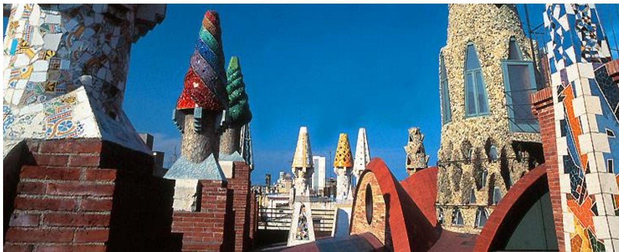
Arkitektur i Barcelona a la Antoni Gaudi

www.youtube.com/watch?v=8DFHyxIJdn0 (film på Youtube med vattenspelet La Font Magica i Barcelona)