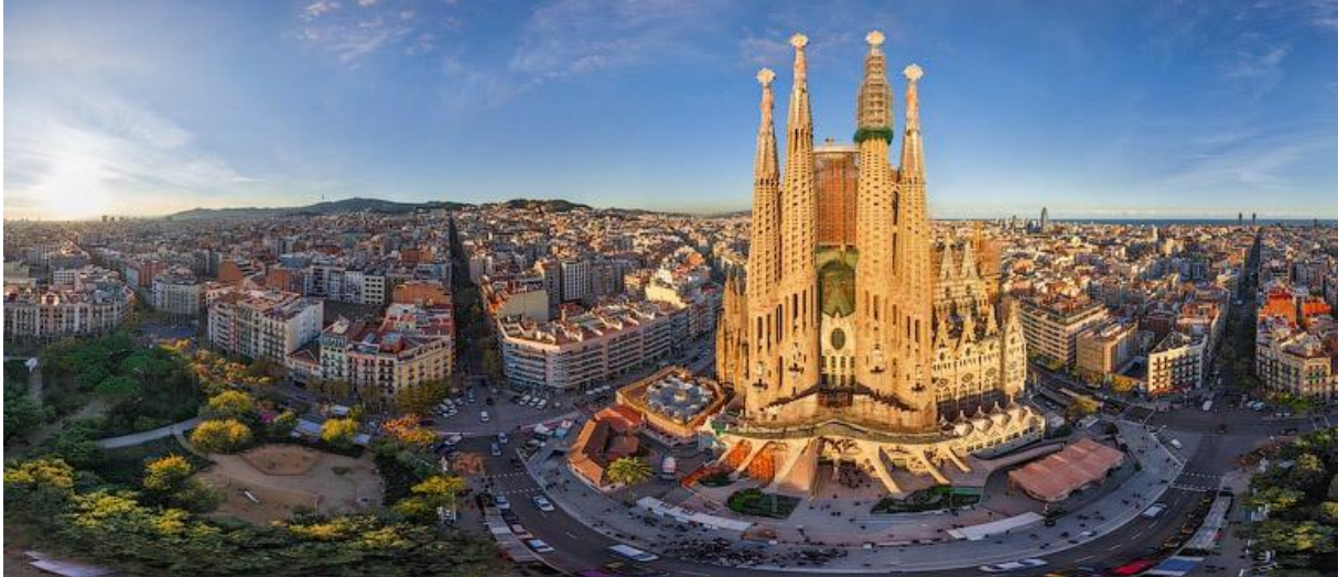
La Sagrada Familia

Förmiddagen ledig till egna aktiviteter. Efter lunch på hotellet beger vi oss tillbaka till vackra Barcelona, staden med över 2 000 år lång och innehållsrik historia. Den medeltida arkitekturen finns fortfarande bevarad i Ciutat Vella, gamla staden. Vi påbörjar stadsrundturen med att upptäcka distriktet Sant Martí som även kallas Kataloniens Silicon Valley. Ett innovativt högteknologiskt affärsområde med många intressanta arkitektoniska byggnader som erbjuder fantastiska kontraster från jugendstil till avantgarde. Turen fortsätter sedan till katedralen La Sagrada Familia av den berömde katalanske arkitekten Antonio Gaudí. Vi stannar här för att i detalj kunna studera dess vackert utsmyckade fasader och fångas av en underbar blandning av natur och arkitektur innan vi fortsätter till den vackra Triumfbågen som var den officiella ingången i den första internationella världsutställningen i Barcelona 1888.